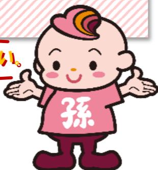
孫の手オリジナルキャラクター 孫ちゃん