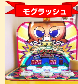
モグラたたきで 運動機能UP!