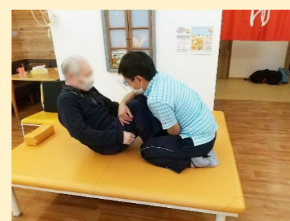
リハビリ専門職による 個別リハビリ②